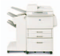
HP LaserJet 9050mfp med stabler som tilbehør

Afdelinger i mellemstore og større virksomheder med arbejdsgrupper på 30-50, der kræver nem netværksadgang til økonomisk, hurtig og pålidelig sort/hvid print og kopiering op til A3, farvescanning og en række fax- og efterbehandlingsmuligheder samt digital afsendelse, der alt i alt resulterer i en forbedret effektivitet, øget produktivitet og strømlinede arbejdsgange.