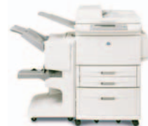
HP LaserJet 9040/9050mfp med multifunktionsfinisher

C8085A – Hæfter/stabler Leverer stabling op til 3.000 ark samt flerpositionshæftning af op til 50 ark papir pr. job.