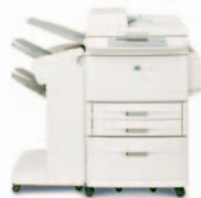
HP LaserJet 9040/9050mfp med stabler

Q5693A – 8-rums mailbox Hver enkelt mailbox kan tildeles en enkeltperson, arbejdsgruppe eller afdeling, så jobbet let kan hentes. Denne mailbox kan også konfigureres som sorteringsenhed, stabler og jobadskiller.